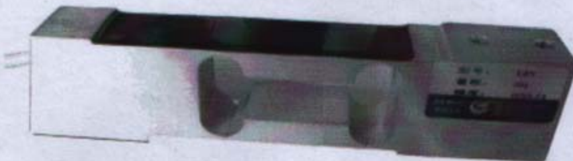
Bild : Wägezelle Typ L6N / 10 kg

The load cells of the series L6N are double bending beam load cells. They are made of aluminium, the strain gauge application is covered with silicon. Further essential characteristics are given in the data sheet, see page 5 to 6.